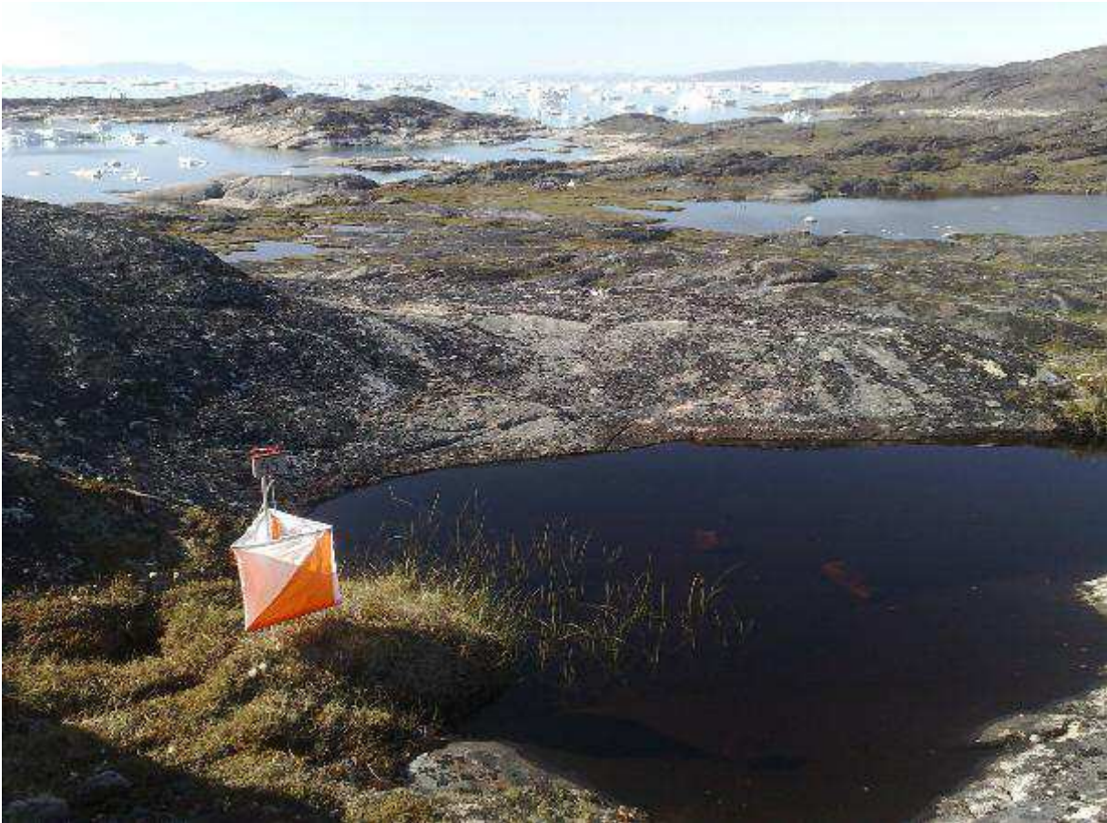
4. post i fotografens løype i Grønlandsmesterskapet.